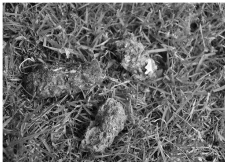
Links: Bosuil Rechts: Braakballen